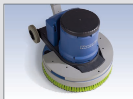
Gueuze de 10 kg supplémentaire en option