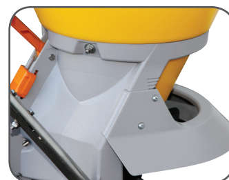
Limiteur d'épandage ajustable