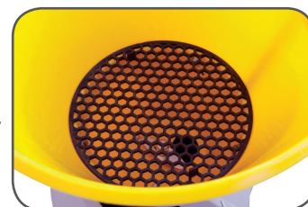
Grille de protection