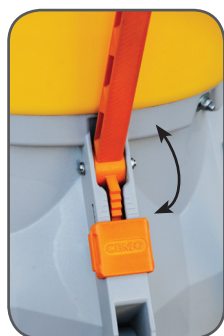
Manette de réglage débit