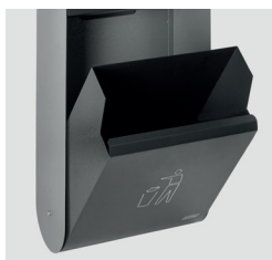
OUVERTURE DU BAC PAR BASCULEMENT