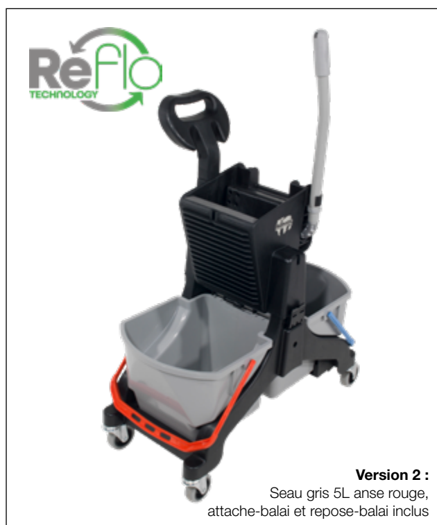
Seau 5L anse rouge