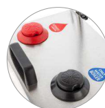
Réservoirs eau et solution nettoyante