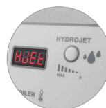
Fonction Hydrojet (H)