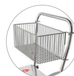
Chariot avec porte accessoires