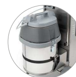
Moteur aspiration de grande puissance (V)