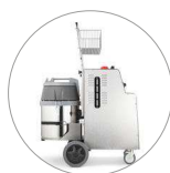
Châssis solide en acier inox