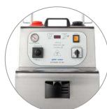
Commande panneau muni d'écran et manomètre