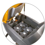
Réservoir de récupération avec ressort à gaz