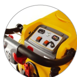
Tableau de commande