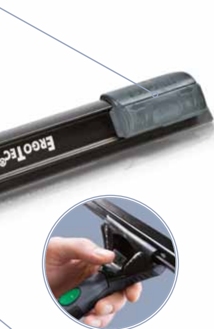
Mécanisme de verrouillage des barrettes TriLoc

Protection des cadres : pour protéger les cadres des fenêtres contre les rayures. Les Smart-Clip se changent facilement à la main ou avec un tournevis.