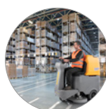
Ergonomie et confort