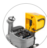
Accès facile à tous les composants