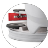
Tête et système d'essuyage en aluminium