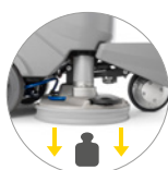
Pression au sol supplémentaire