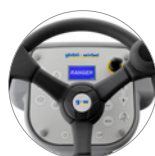
Commande panneau muni d'écran