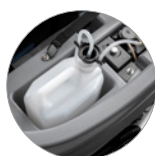
Chemical mixing system