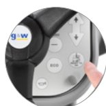
Fonction "Ready to go"